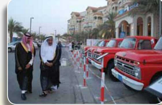
الإفتتاح الرسمي للفندق The official opening of the Hotel