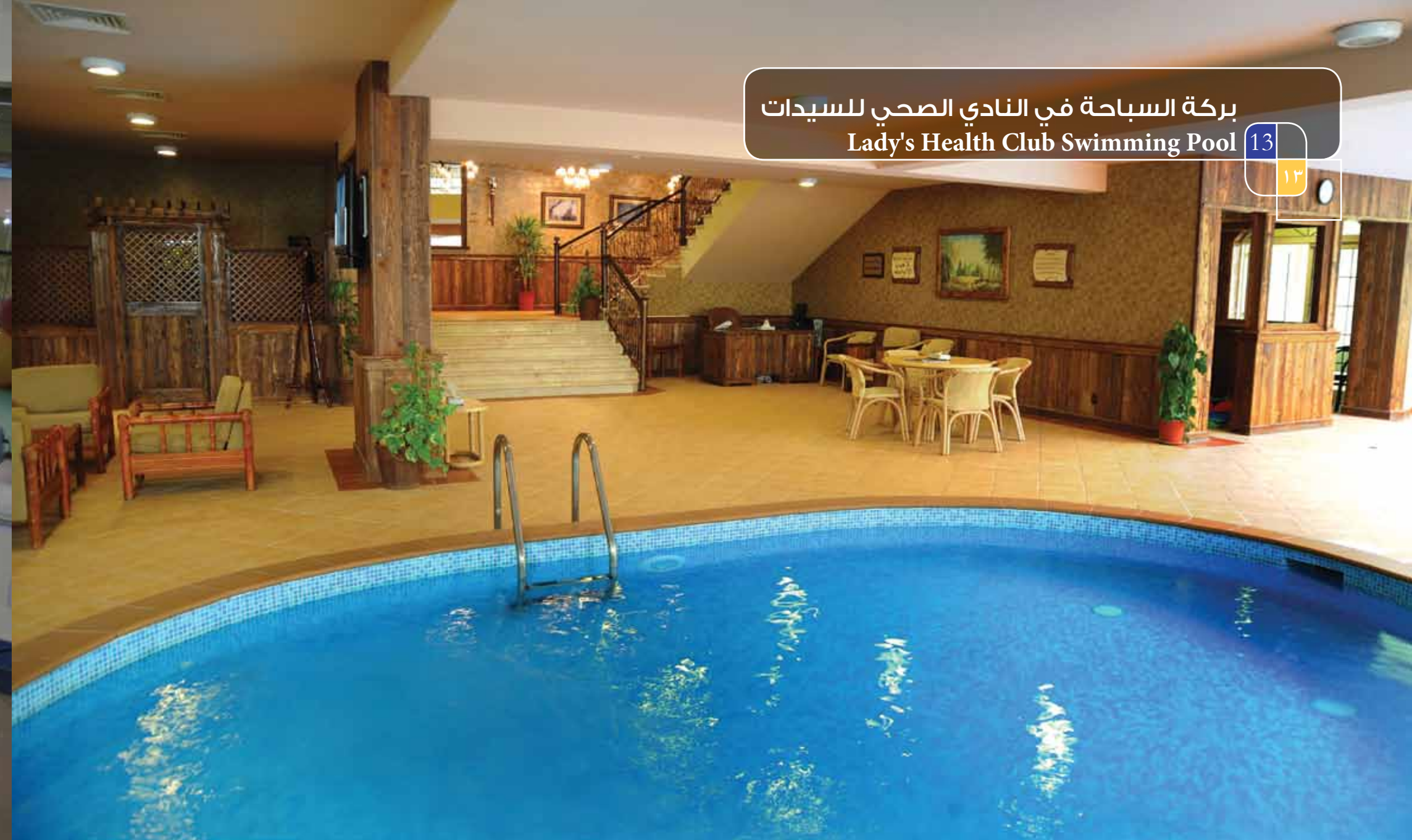
بركة السباحة في النادي الصحي للسيدات Lady's Health Club Swimming Pool