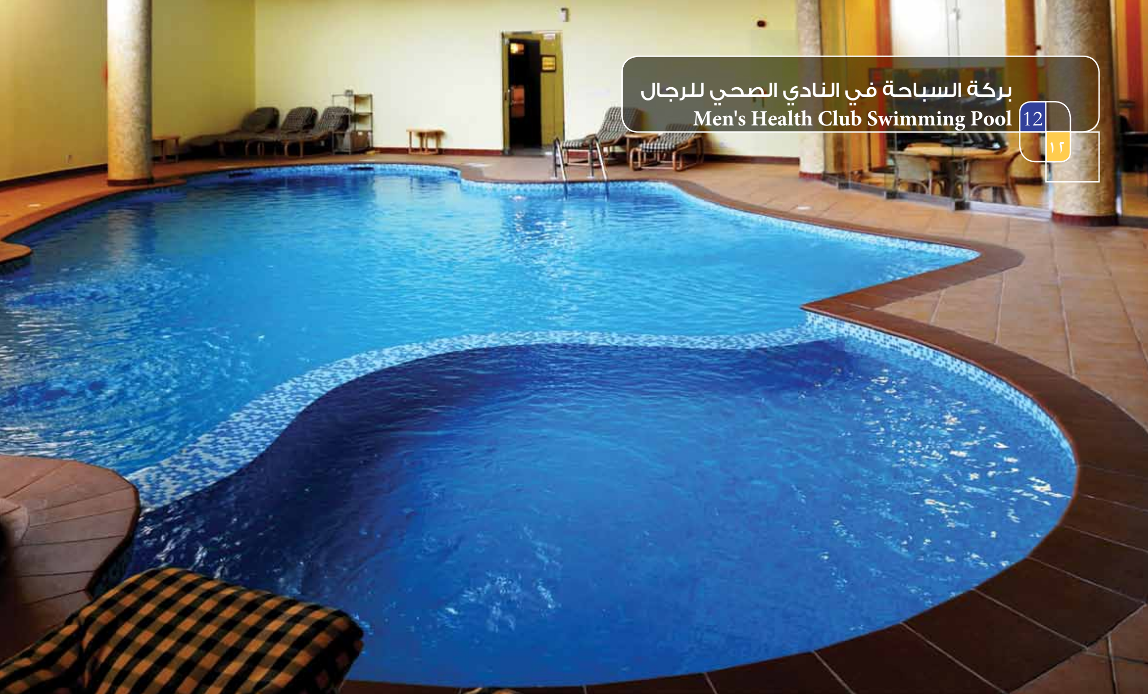
بركة السباحة في النادي الصحي للرجال Men's Health Club Swimming Pool