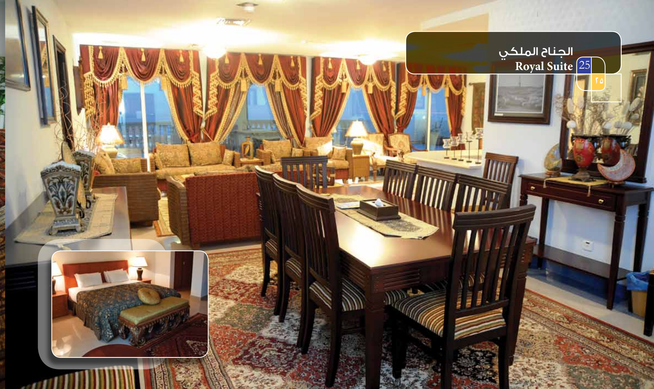
الجنّاح الملكي Royal Suite