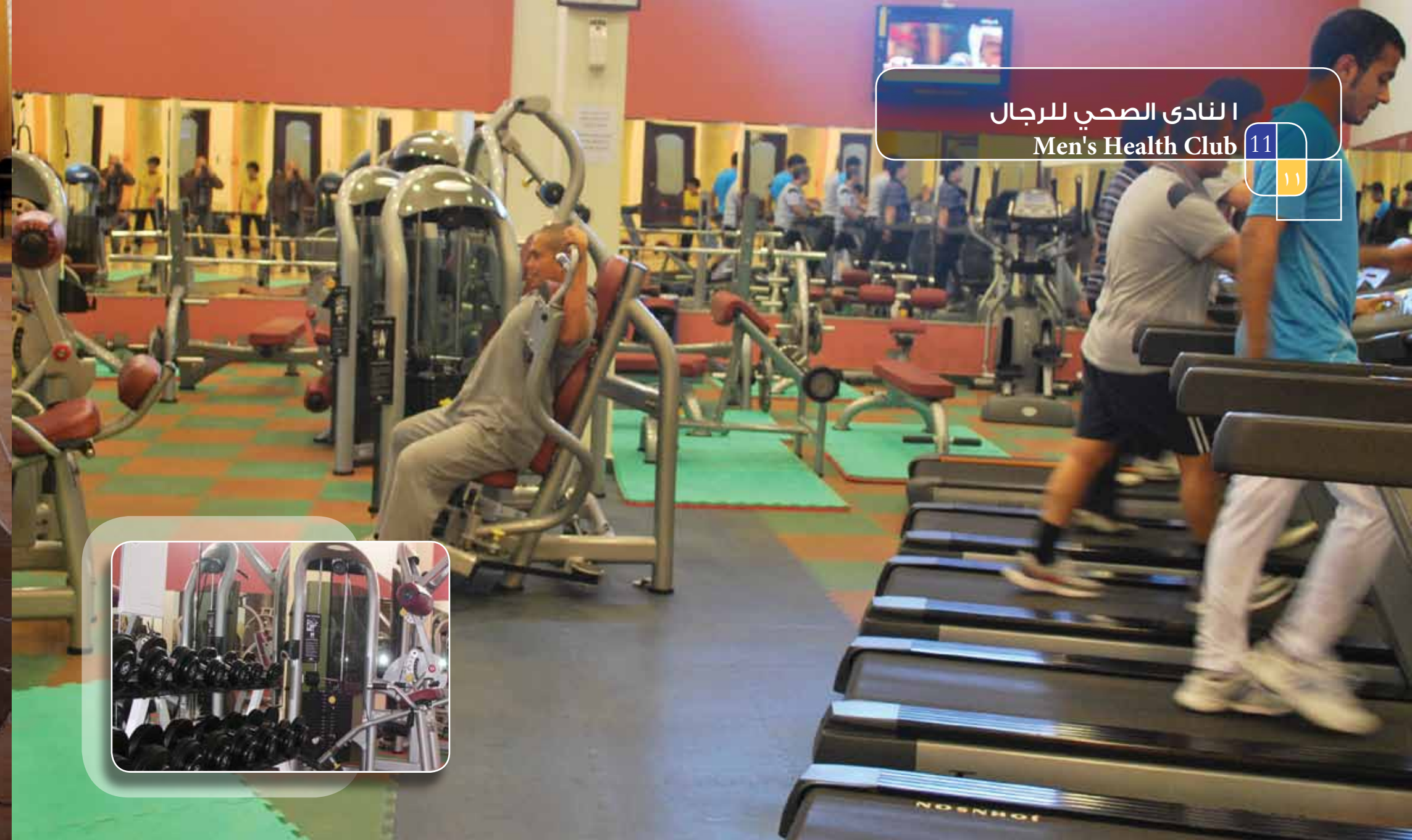
النادي الصحي للرجال Men's Health Club