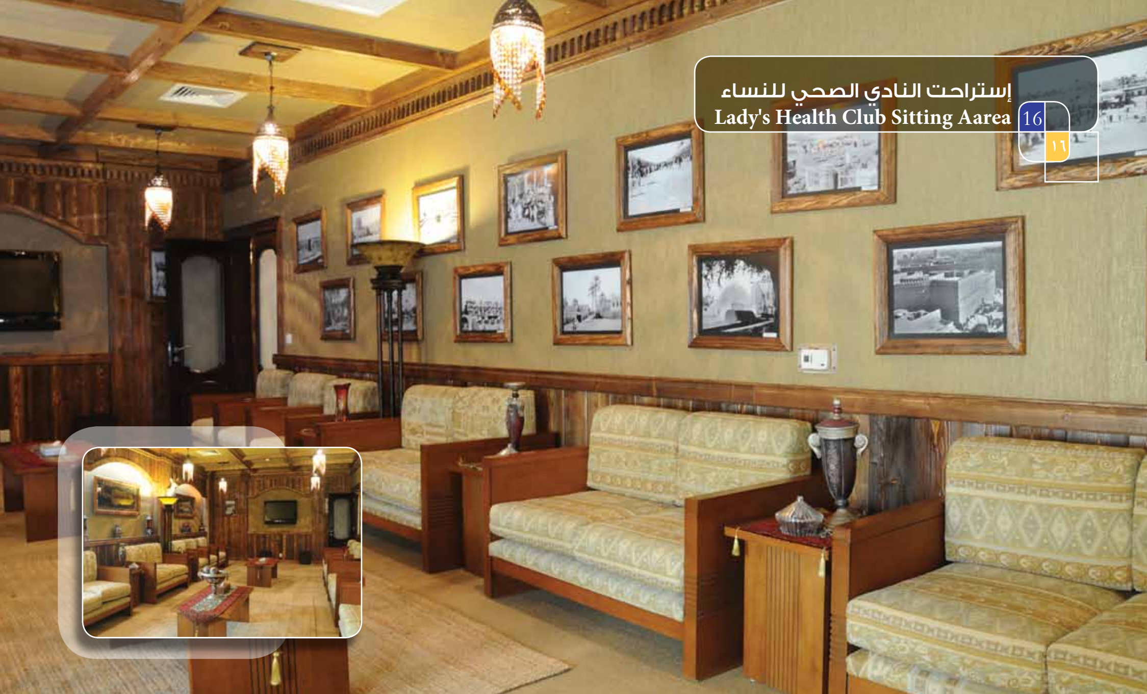
إستراحت النادي الصحي للنساء Lady's Health Club Sitting Aarea