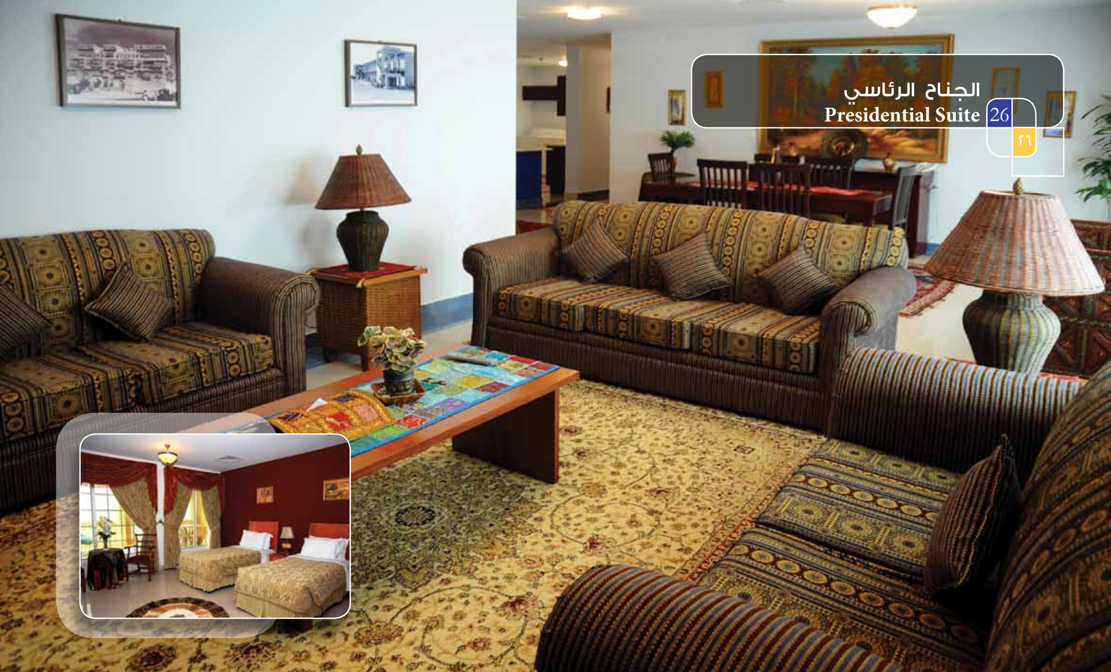
الجنّاح الرئاسي Presidential Suite