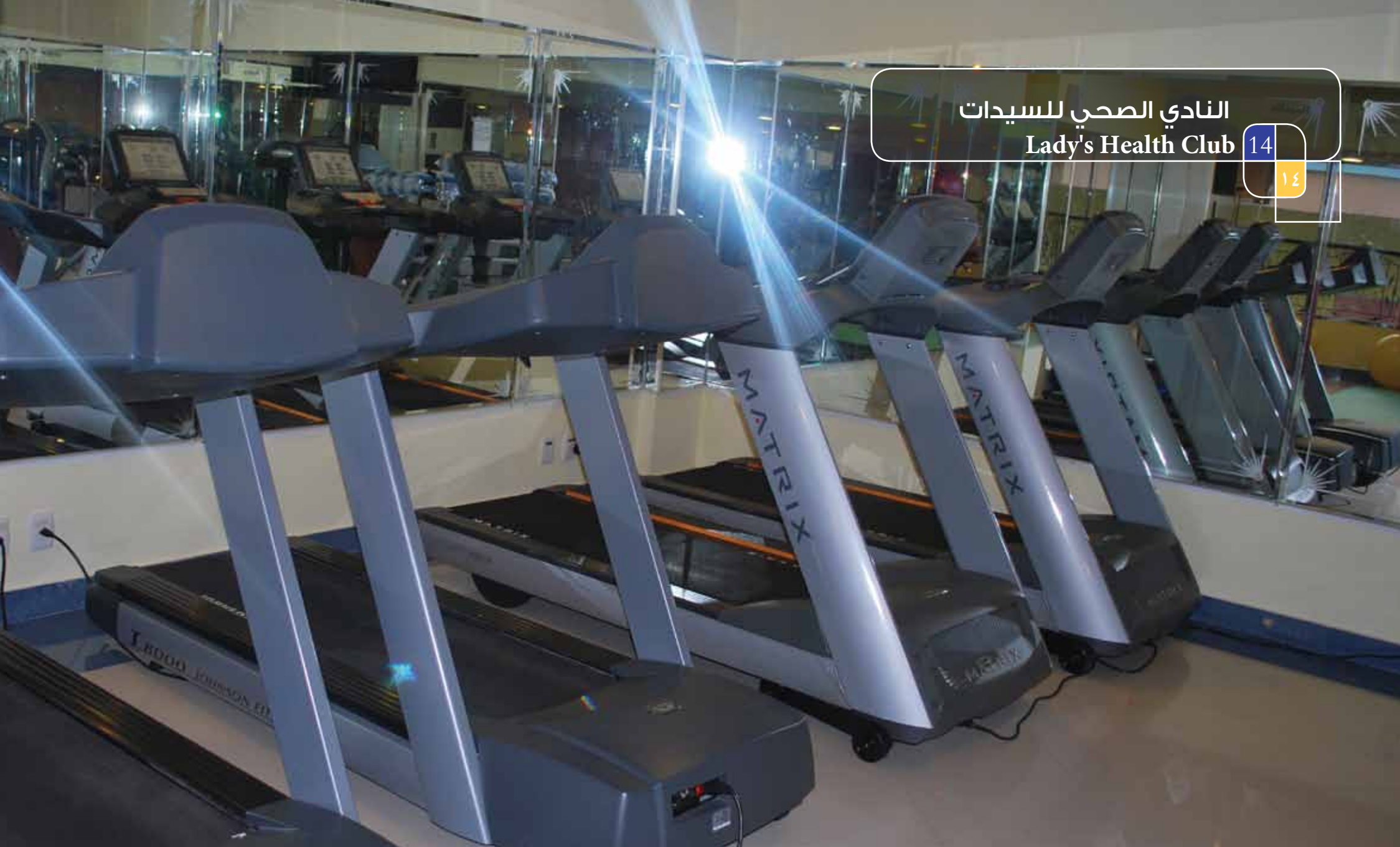
النادي الصحي للسيدات Lady's Health Club