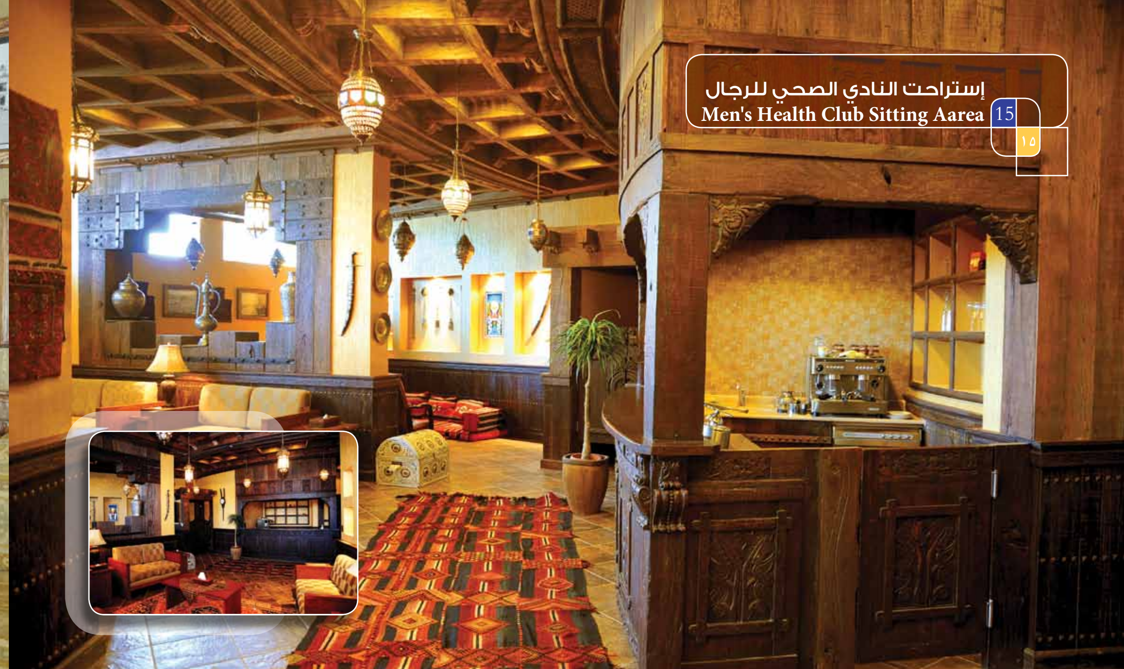
إستراحت النادي الصحي للرجال Men's Health Club Sitting Aarea