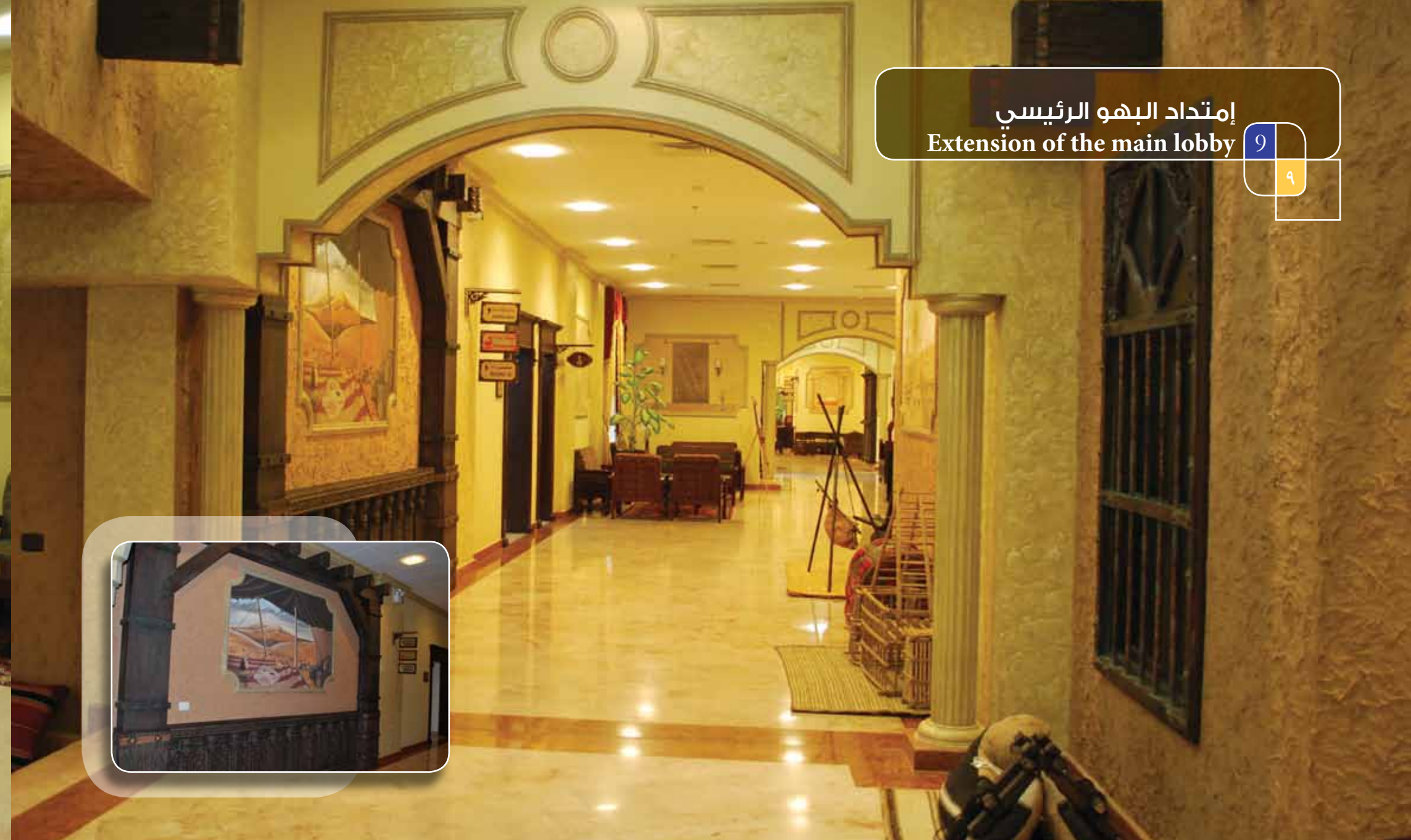
إمتداد البهو الرئيسي Extension of the main lobby